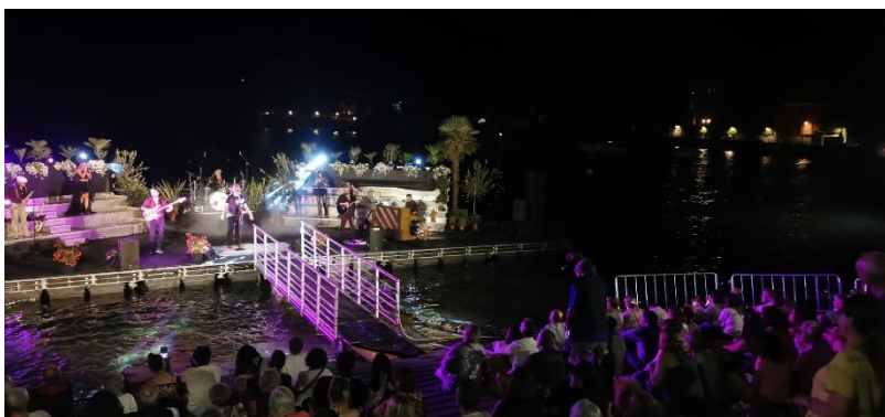
A sinistra lo spettacolo pirotecnico del 14 agosto. In alto il pubblico in piazza, in basso a destra l'esibizione della band in tributo ai Dire Straits.