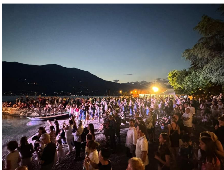
In alto l'esibizione del 14 luglio della Casanova Venice ensemble, a sinistra l'esibizione vista dalle Lucie, a destra il pubblico all'esibizione del 13 luglio dei 7S8SETTESOTTO