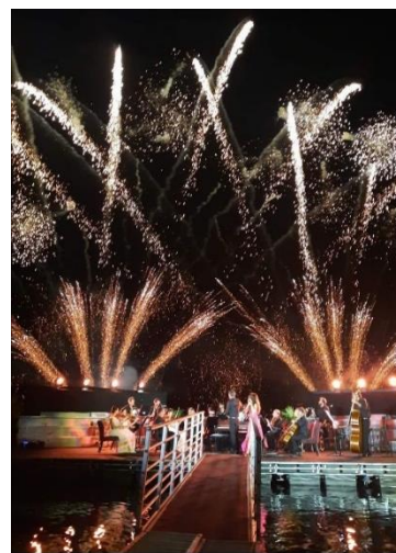
A sinistra uno spettacolo a Lecco nel 2023. Al centro il palco galleggiante nel golfo di Venere a Lenno e a destra durante lo spettacolo del 15 agosto